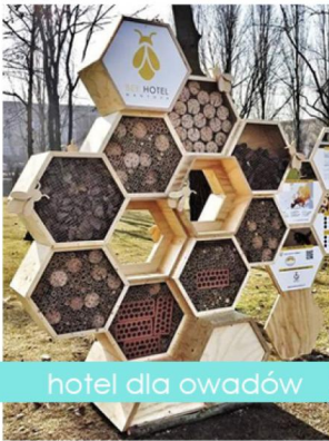
hotel dla owadów