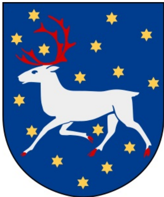
Hrabstwo Västerbotten (Szwecja)