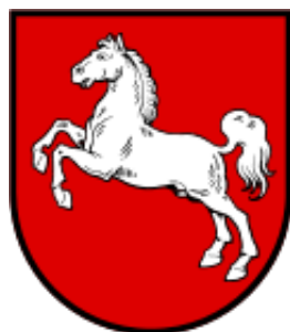
Kraj Związkowy Dolna Saksonia (Niemcy)