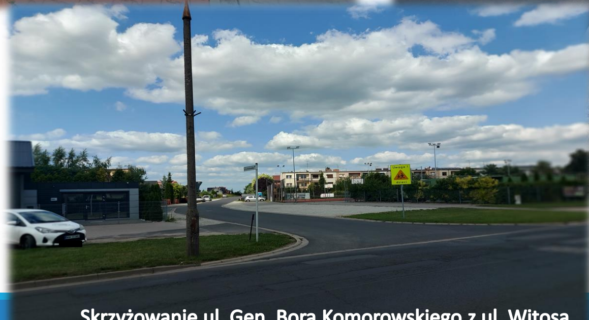
Skrzyżowanie ul. Gen. Bora Komorowskiego z ul. Witosa