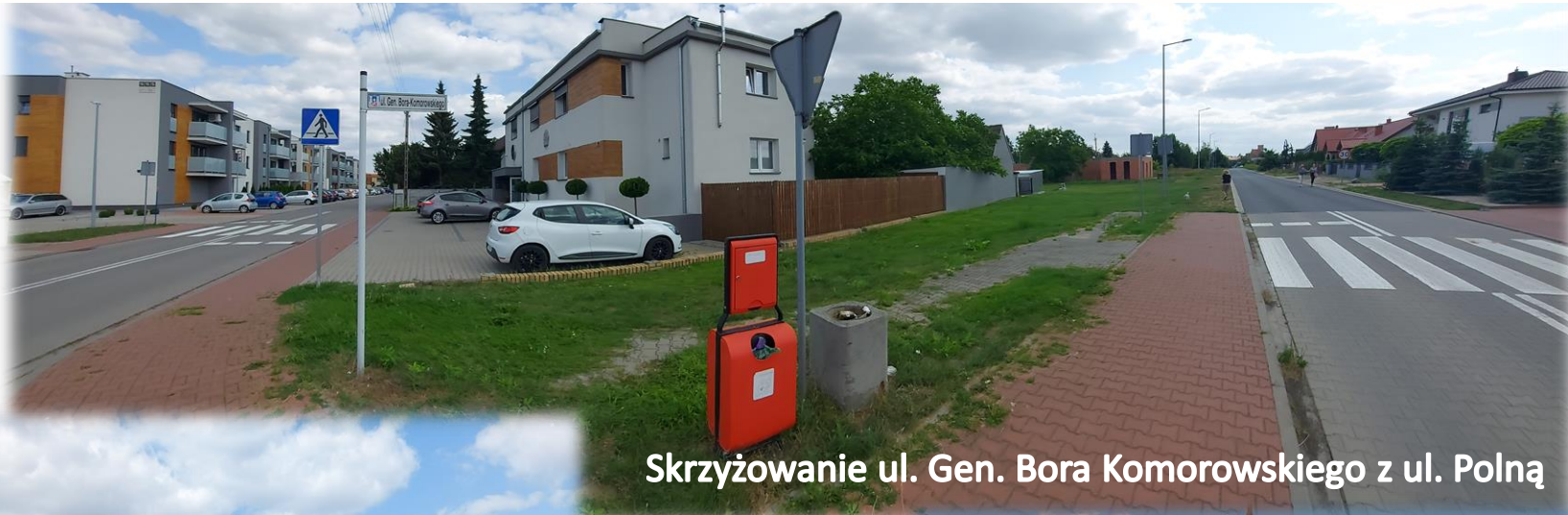
Skrzyżowanie ul. Gen. Bora Komorowskiego z ul. Polną