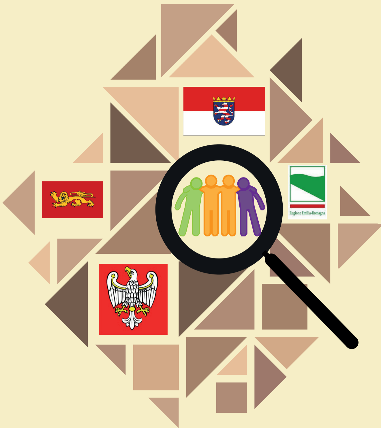
Illustration: Meike Bohland, Kunsthochschule Kassel

Konkurs w regionach Europy. Patronat nad konkursem objął Marszałek Województwa Wielkopolskiego i jego odpowiednicy w regionach partnerskich