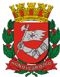
Herb i Flaga Regionu