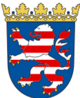
Bundesland Hessen (Deutschland)