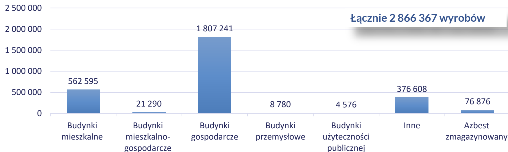
Wyroby do usunięcia wg rodzaju obiektu [szt.]