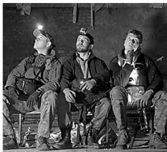
Urbex History 432K