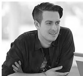
Topowa Dycha 1mln