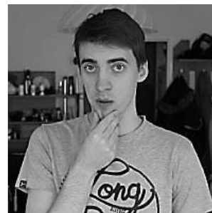
Planeta Faktów 2mln