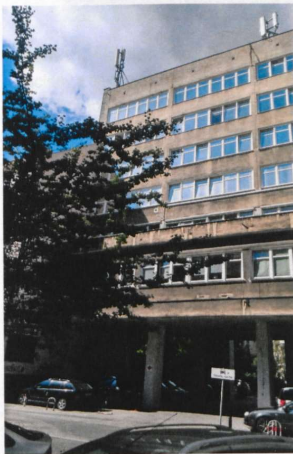
WIDOK OD STRONY ULICY