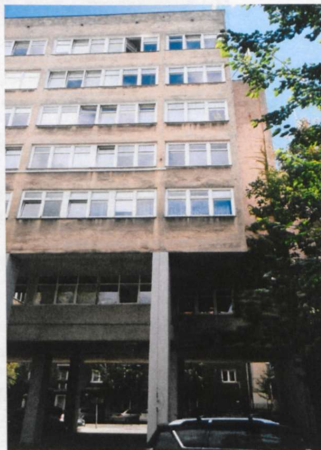
WIDOK OD STRONY PODWÓRZA