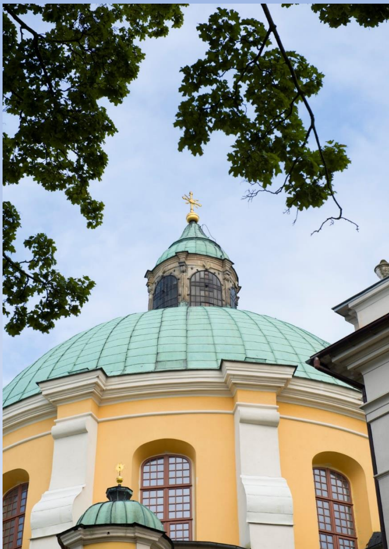
Renowacja konserwatorska latarni.