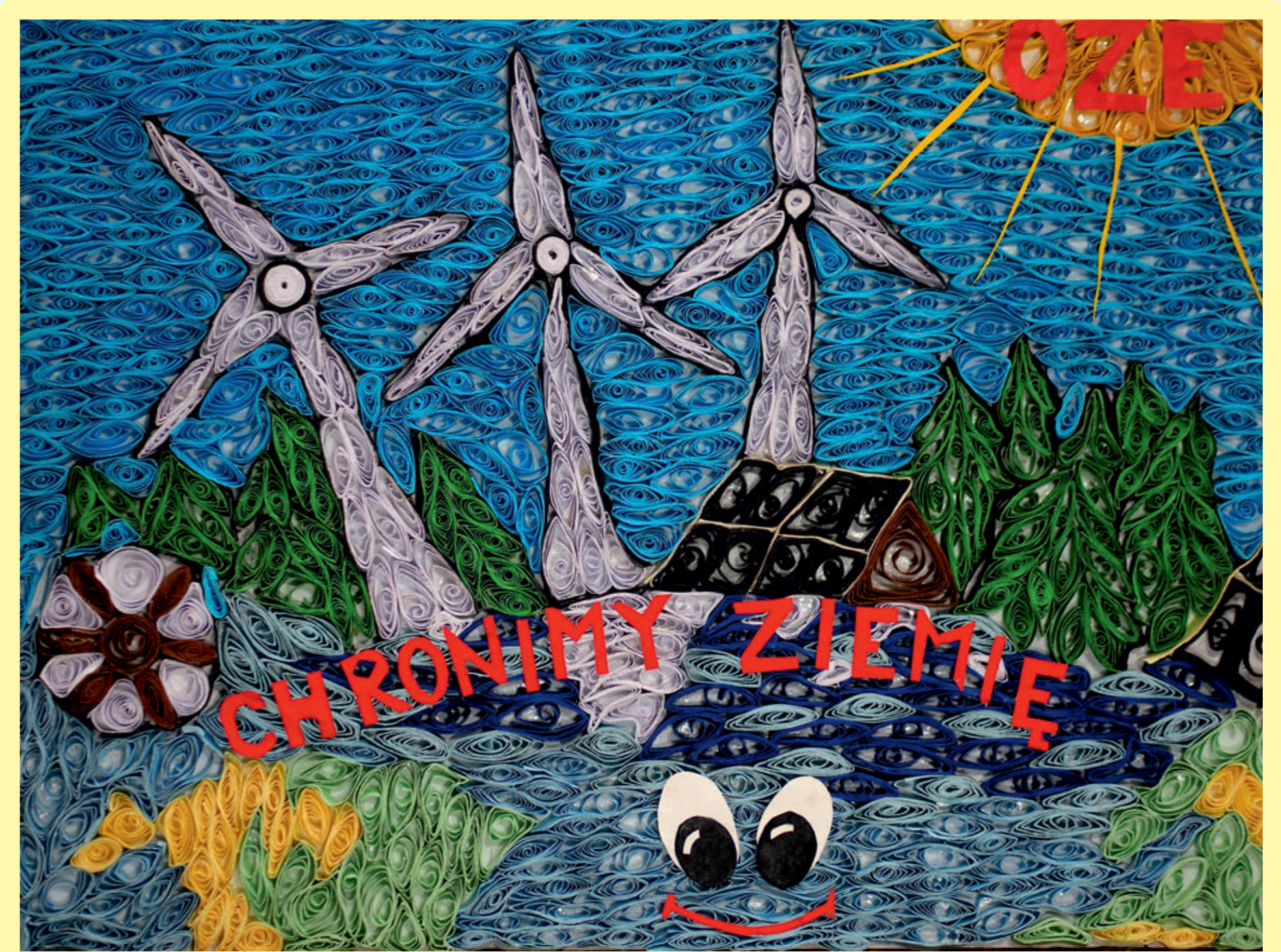
Paulina Bukczyńska (kl. VI) – subregion poznański Szkoła Podstawowa nr 2 im. Teofili z Działyńskich Szoldrskiej-Potulickiej w Kórniku