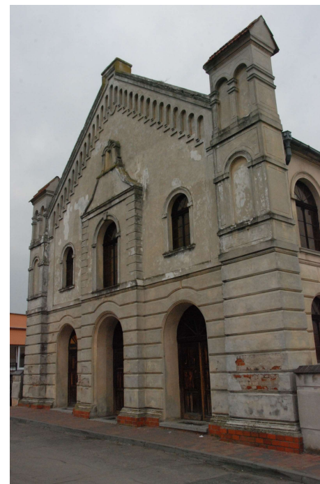
Synagoga w Buku – stan obecny

Stan techniczny budynku, brak ogrzewania i zaplecza sanitarnego, nie pozwala na jego stałe użytkowanie. Synagoga dla szerszej publiczności otwarta jest jedynie jeden raz w roku w ramach Dni Kultury Żydowskiej w Wielkopolsce.