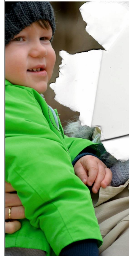
rodzice bez dzieci dzieci bez rodziców

Kto zajmie się dziećmi? Kto zajmie się rodzicami?